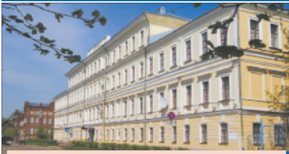
Самый популярный у выпускников костромских школ Технологический университет

478 выпускников костромских школ (39% от общего числа) в этом году поступили в вузы за пределами города: в Москве, Санкт-Петербурге, Иваново, Ярославле. Об этом сообщает пресс-служба городской