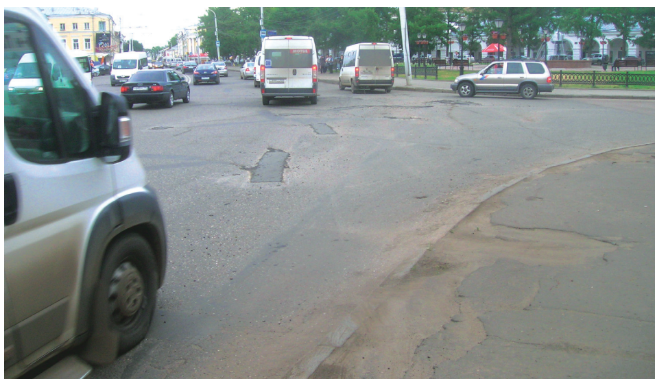
Ямы на Воскресенской площади