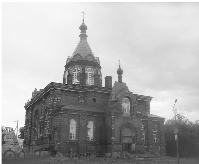
Церковь в центре Макарьева, поставившая крест на алкогольной лицензии

Кадый - Макарьев - Мантурово - Шарья - Островское - Кострома