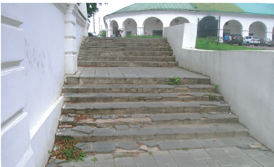
Типичная костромская лестница