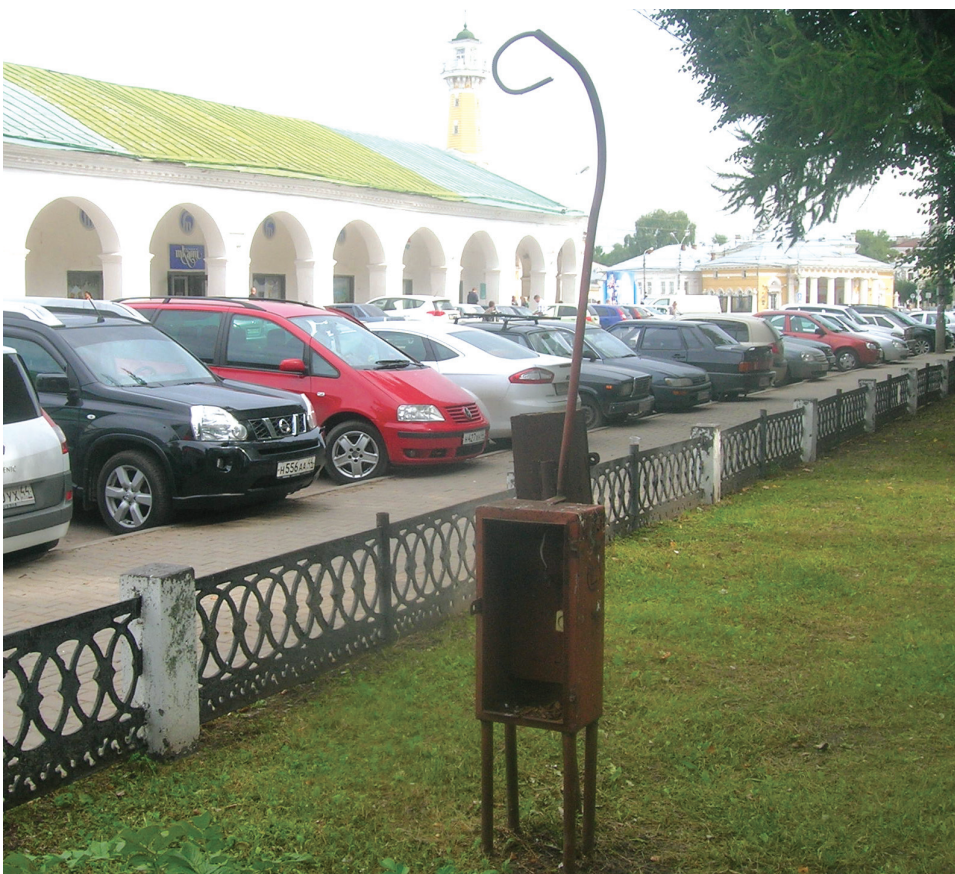
Памятник костромской бесхозяйственности в сквере у памятника Сусанину