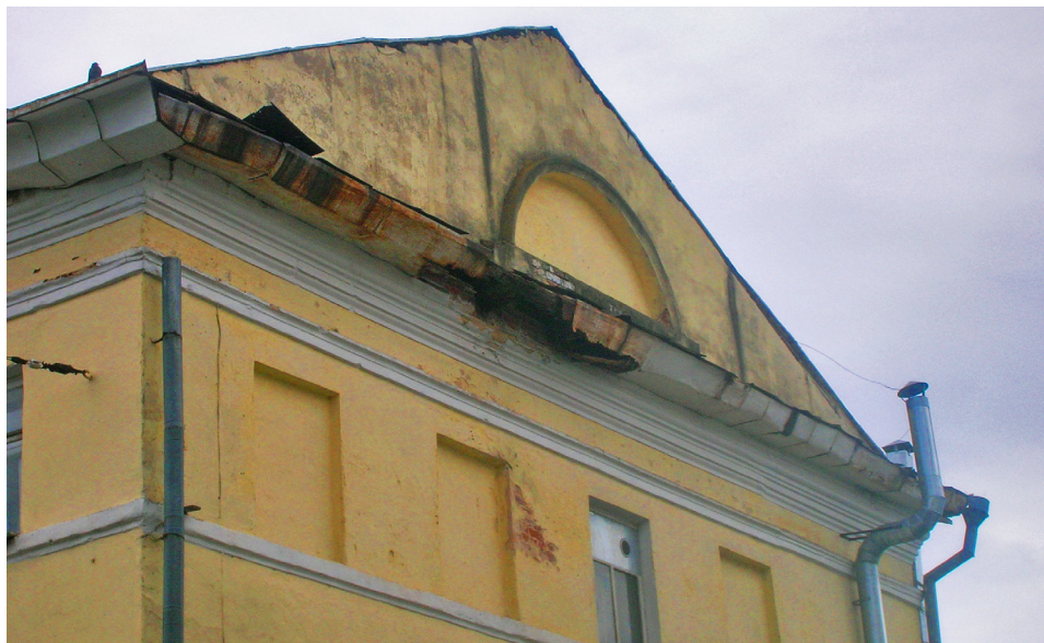
Дом в самом начале проспекта Мира, в котором, как гласит мемориальная доска, жил А.Н. Островский