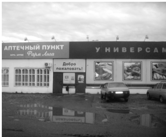
«Высшая лига» в Островском