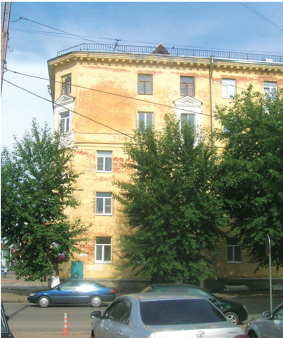
Дом на углу улиц Советской и Энгельса