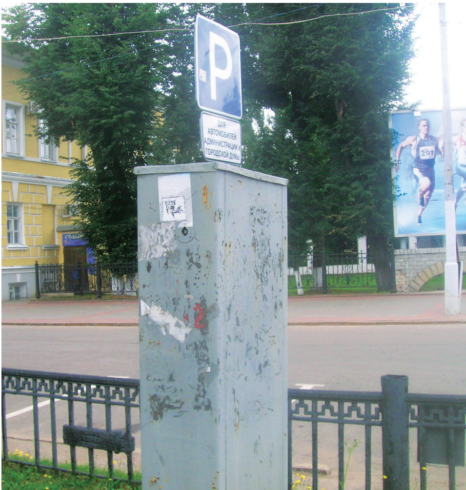
«Памятник городской администрации» в Ботниковском сквере